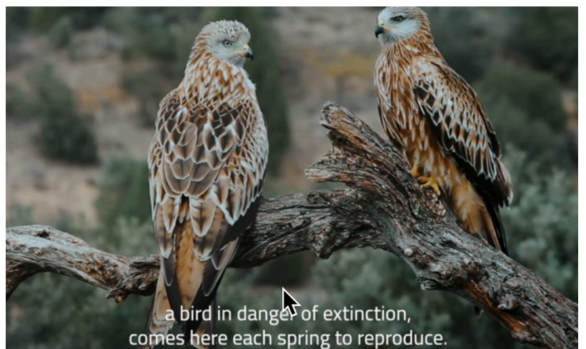
20 broedparen van de rode wouw!